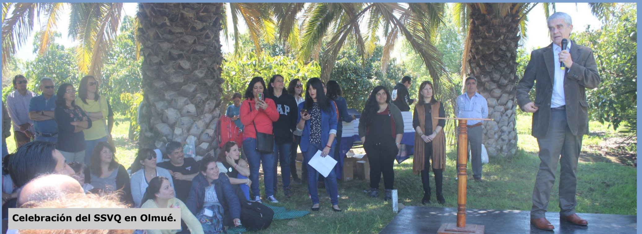
Celebración del SSVQ en Olmué.